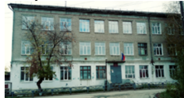
Беседовала Руслана БАЕВА Фото из открытых источников.

Источник: Геннадий Веришин «Зарека моя, Зарека».