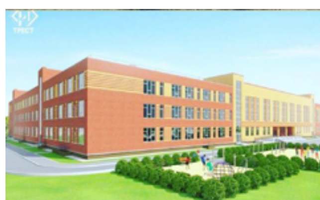
А так будет выглядеть новая Лысьвенская школа.

6. Строительство новой школы на улице Балахнина - совместный результат подключения к решению этого важного для Лысьвы и лысьвенцев вопроса местных и региональных единороссов.