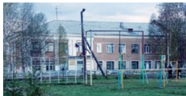
Спортивная площадка у школы №11 может пополниться новыми формами.

В 2019 году в Лысьве планируется строительство всего трех детско-спортивных площадок. И за решение о местах их размещения развернулась настоящая битва. Своей позиции я придерживаюсь всегда: частный сектор Лысьвы и ее