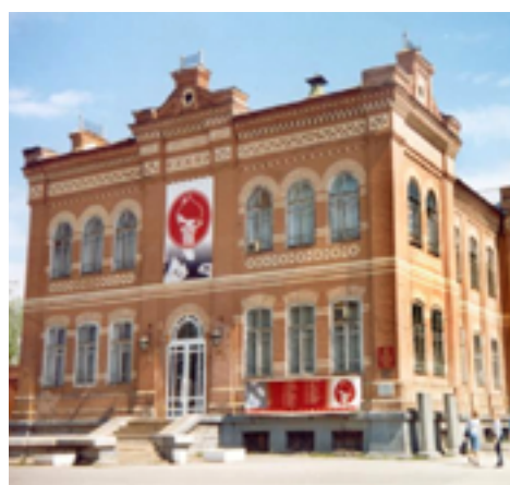
Благодаря партийному проекту в лысьвенском театре была поставлена серия спектаклей и приобретено сценическое оборудование, позволяющее создавать постановки нового уровня.

3. Проект партии «ЕДИНАЯ РОССИЯ» «Культура малой родины» реализовывался на базе Лысьвенского драматического театра имени Анатолия Савина. Он позволил привлечь 7,2 миллиона рублей средств краевого и федерального бюджетов.