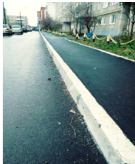
Какая это Москва? Какая Пермь? Это Лысьва, двор по адресу: Проспект Победы, д.23.

2. Ремонт дворовых территорий, включающих 6 многоквартирных домов, расположенных по адресам: Пр. Победы, д. 21, д. 23, ул. Федосеева, д. 54, д. 56, д. 58, ул. Чапаева, д. 26.