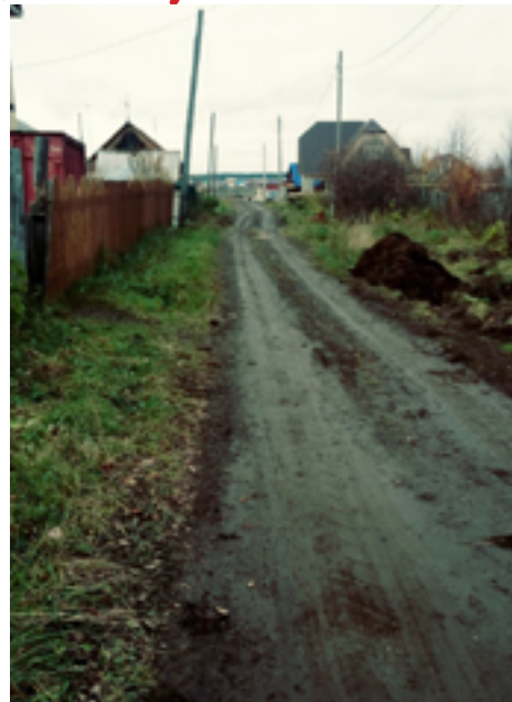
Улица Сурикова является одной из самых западных улиц Лысьвы. Она находится почти под самой Каланчой. После отсыпки ее в этом году улица стала вполне проезжей.

- Сейчас идет документальная работа по передаче земли от «Почты