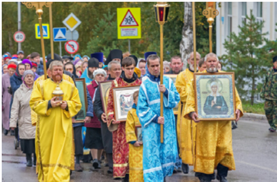
За согласие, консолидацию и во благо общества Лысьвы. Крестный ход по улицам Лысьвы в честь Пресвятой Богородицы, покровительницы России.

Мы сотрудничаем, ибо по большому счёту цели-то у нас общие: улучшение жизни людей. Слуги народа не могут идти против людей. Мы переживаем за местную власть.