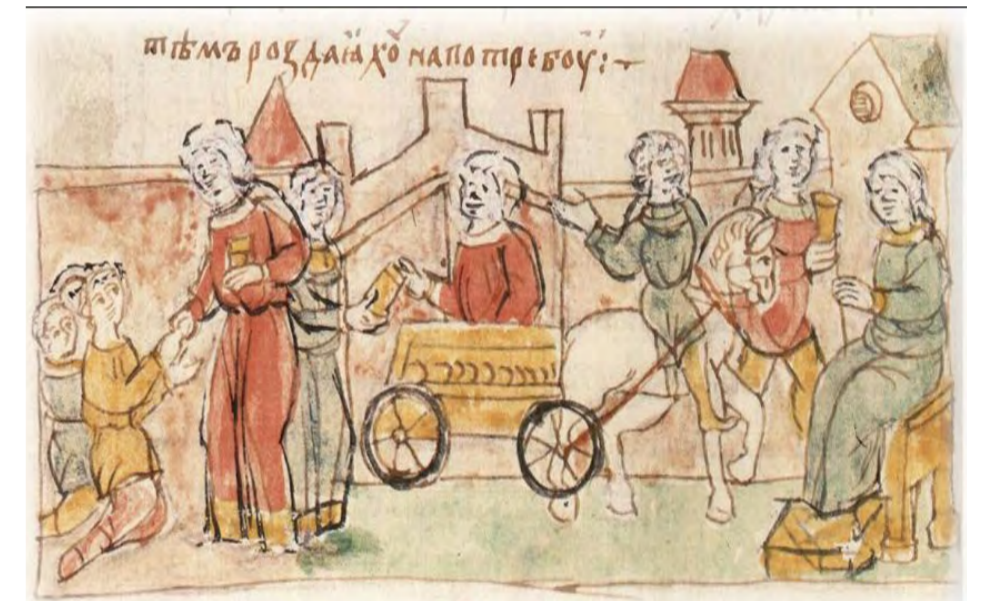
Раздача по повелению Владимира Святославича большим и нищим разных яств, развозимых на телеге: хлеба, мяса, рыбы, меда, кваса. Раздвиговская летопись.

В целом же христианство по всей стране принимали добровольно. Его не пришлось навязывать «огнем и мечом» — это поздний миф, не имеющий под собой подтверждений в древних источниках. Слабость и пестрота язычества, уверенная поддержка Церкви правителем, давнее знакомство с христианством в больших городских центрах сделали свое дело: Христианская вера утвердилась на Руси скоро и почти бескровно. Не стоит удивляться — к тому времени, когда произошло официальное общегосударственное крещение, христианство уже более века частным образом распространялось на огромных пространствах от Киева до Новгорода. В Киеве задолго до Владимира стояли малые церковки. В дружинах варяжских, находившихся на службе у русских князей, часто встречались простые воины и знатные люди, принявшие Христианству веру. Бабка Владимира, княгиня Ольга, тремя десятилетиями ранее посетила столицу Византии и вернулась оттуда христианкой. Откуда быть надрыву и кровопролитию, когда к христианству на Руси давным-давно... привыкли?