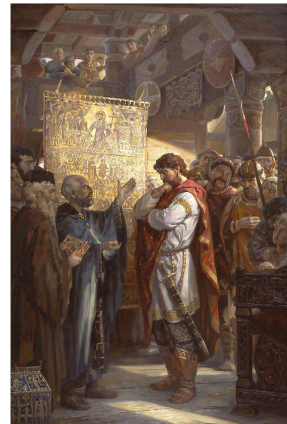
Выбор веры князем Владимиром Худ. А. Ю. Филатов.

Возникновению государственности в России содействовали варяги. А своему духовному рождению русский народ обязан Православной Церкви. Ведь именно Церковь помогла объединить в единое целое весь тот богатый спектр славянских, финских, монгольских и скандинавских разнородных элементов, которые образовывали Южно-Русские княжества.