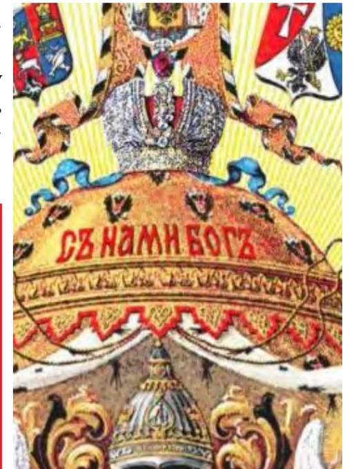
Фрагмент Большого Государственного Герба Российской империи (1882г.). В центре герба червлёная надпись: «Съ Нами Богъ!».

Человека от Бога, не дать ему спастись, погубить, свести во ад... Вот, например, отношения между Россией и Украиной - странами, имеющими общие корни и род-