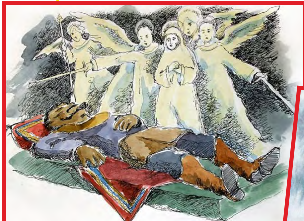
Явление Пресвятой Богородицы Тамерлану во сне.