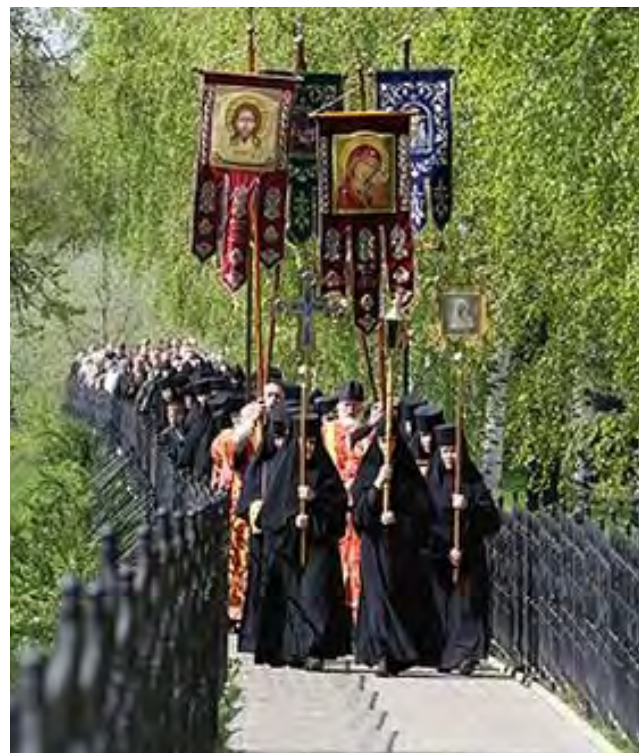
Крестный ход на Святой Канавке.

Сестры, пораженные таким чудом, не откладывая, принялись копать заповеданную Канавку. Рыли сестры эту канавку до самой кончины батюшкиной, к концу его жизни, по приказанию его, и зимой и летом не переставая, огонь брызгал от земли, когда топором ее рубили, но переставать не велел. Свой тяжелый трехлетний труд они завершили к празднику Рождества Христова 1833 года. Первая Канавка не была трехаршинной: где на аршин, а где и на поларшина