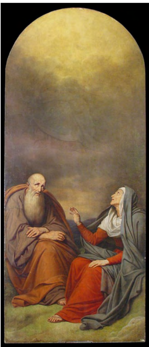
К. А. Штейбен. Иоаким и Анна. 1843-1854 гг., холст, масло.

Что уж говорить об эпохе ветхозаветной, – когда главное свое упование верующие люди возлагали на пришествие в мир Спасителя и потому стремились любыми законными путями продолжить свой род, чтобы их потомки и весь народ Израиля дожил до этого обещанного Богом через пророков дня искупления? Деторождение считалось не чем иным, как священным долгом каждого благочестивого иудея перед своим народом. Причем особенно