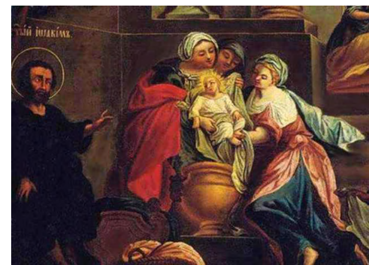
Иван Вишняков. Рождение Богородицы. 1745 год.

Божью, для чего прислал за Ней корабль. Но уже вблизи от Кипра сильным ветром судно было увлечено в другую сторону и пристало у берегов неведомой тогда страны. Пресвятая Богородица увидела в случившемся волю Божию и, прервав Свое путешествие, нача-