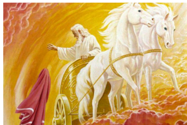
Святой пророк Илия был восхищен на небо на огненной колеснице. Чтобы вернуться на землю в будущем перед пришествием Антихриста и ревностно побуждать к покаянию тех, кто будет жить в последние времена. Какое удивительное управление Божие! Не так ли Воздушный десант уходит в небо, что бы после, с высот, обрушиться на головы врага?

Святой апостол и Евангелист Иоанн Богослов в Книге Откровения говорит о том, что перед пришествием Антихриста Енох, ветхозаветный праведник, о котором мы читаем в Книге Бытия, и Илия