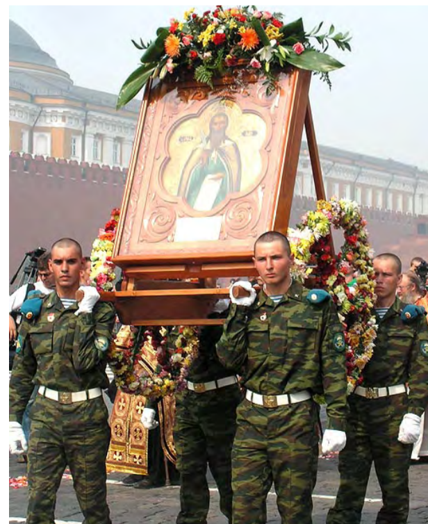
Москва, Красная площадь. Крестный ход в честь св. Илии в День Воздушно-десантных войск России.

В ВДВ есть десантируемый полевой храм, который может быть сброшен на парашютах и развернут на платформе в любом месте.