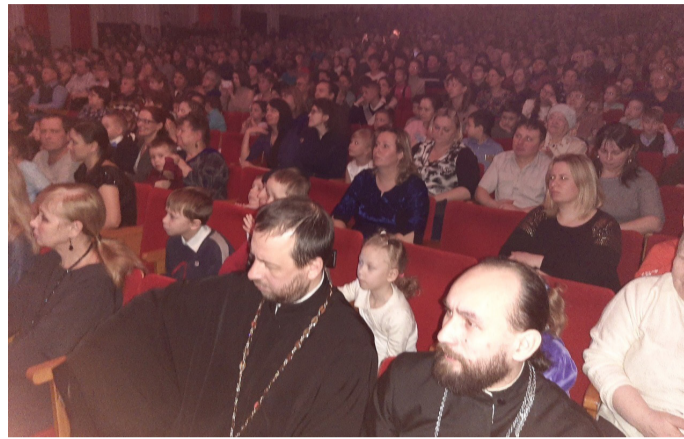
Рождество в Лысьве. ЛКДЦ. Главный зрительный зал Лысьвы полностью заполнен лысьвенцами.