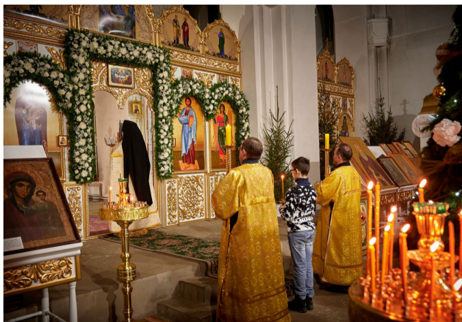
Рождество в Лысьве. Храм Святой Троицы. Торжественное Богослужение.