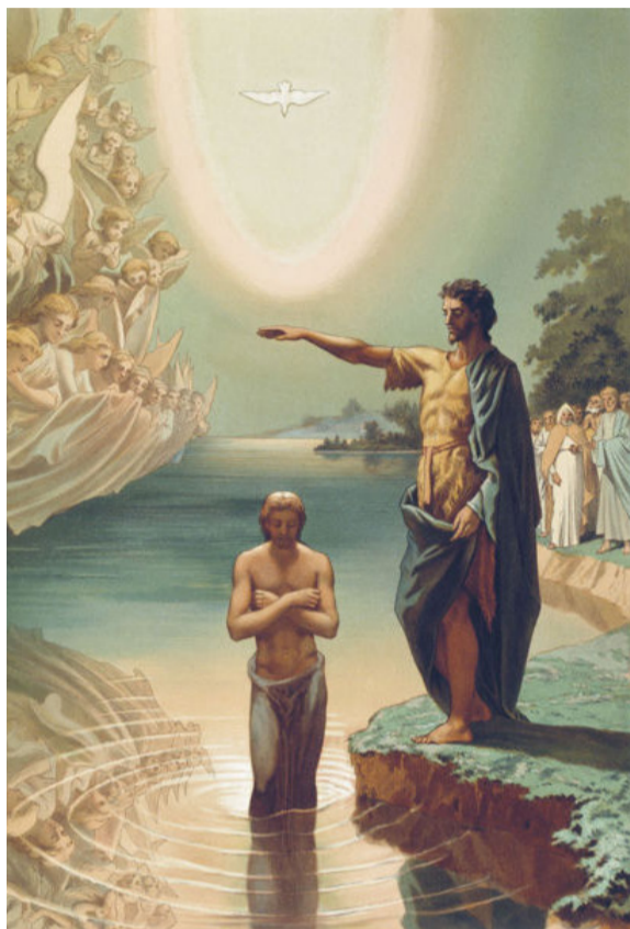
Крещение Христово Гагарин Григорий Григорьевич. 1860 г.

Крестившись от Иоанна, который затрепетал от просьбы Христа, Господь исполнил «правду», то есть верность и послушание заповедям Божиим. Святой Иоанн Предтеча принял от Бога повеление крестить народ в знак очищения