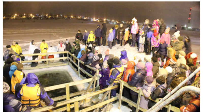
Лысьвенский пруд. Освящение Иордани.

Господь приемлет одних смиренных, преисполненных сознания своей греховности и ничтожества, преисполненных покаяния, а от гордых отвращается. Отвращение лица Господня от дерз-