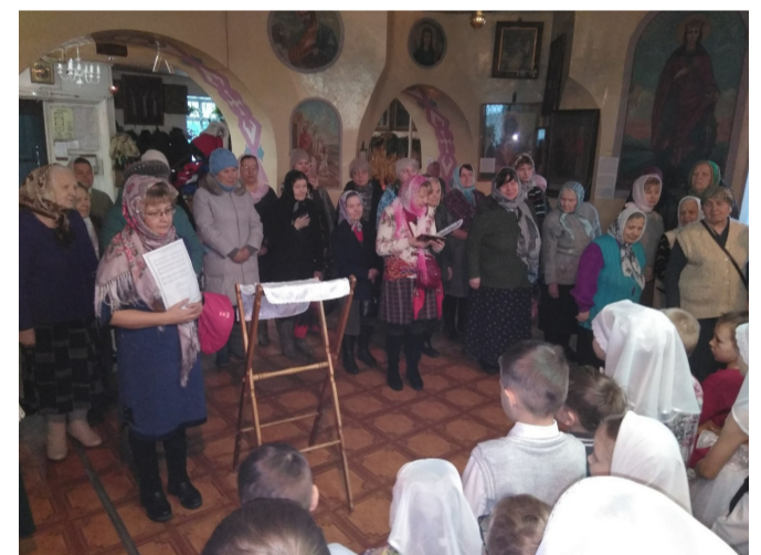
Рождество в Лысьве. В Рождественском поздравлении учащихся воскресной школы храма Иоанна Богослова были прочитаны праздничные стихи, спеты праздничные песнопения.