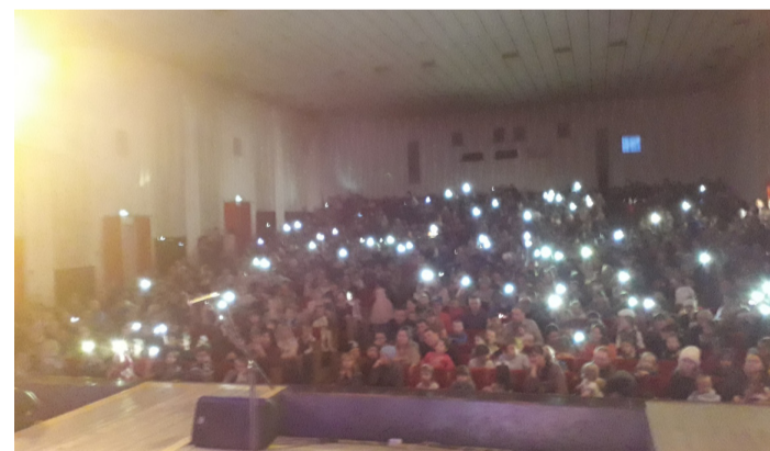
Рождество в Лысьве. В зале ЛКДЦ зажглись фонарики. Это означает, что сердца зрителей засветили любовью!