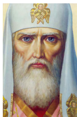
Митрополит Алексей — митрополит Киевский и всея Руси, епископ, государственный деятель, дипломат. В церковно-богослужбных текстах именуется «святителем Московским и всея России чудотворцем». Сын боярина Фёдора Бяконта.

Преподобный Сергий не занимал высокого положения в русской церковной иерархии. Но сила его обаяния и авторитета, его популярность были так велики, что уже в конце 60-х годов XIV века о нем знают за пределами Руси. Его высоко ценят в Константинополе: патриарх Филофей награждает его крестом и грамотой. Особенно сильное влияние Сергий имел на великого князя Московского Дмитрия Ивановича. Ни одного серьезного государственного дела Дмитрий Иванович не проводил без совета и благословения Сергия. После смерти великого святого земли Русской Московского Митрополита Алексея (12 февраля 1378 г.) преподобному Сергию была предложена митрополичья кафедра, которую ему еще при жизни хотел поручить Митрополит Алексей, но он от нее категорически отказался.