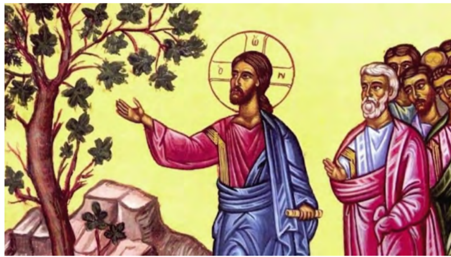
Иссохшая смоковница символизирует о том, что без веры человек пред Богом духовно мертв.

Из событий евангельских Святая Церковь воспоминает искушение бесплодной смоковницы.