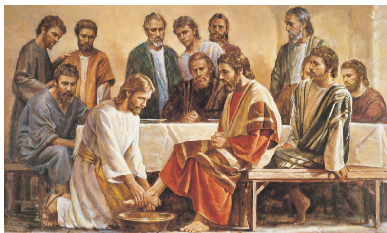
Омовение ног — описанное в Евангелии событие, характеризующее крайнее смирение Иисуса Христа, а также подражающий ему обряд в богослужбной практике ряда христианских церквей.

Казалось бы, что и железное сердце должно было расплавиться от такого проявления всепрощающей любви и смирения; но сердце Иуды стало уже недоступным добру; смирение Иисуса не тронуло его, а скорее поселило в нем уверенность, что его предательство сохраняется синагедрином в строгом секрете.