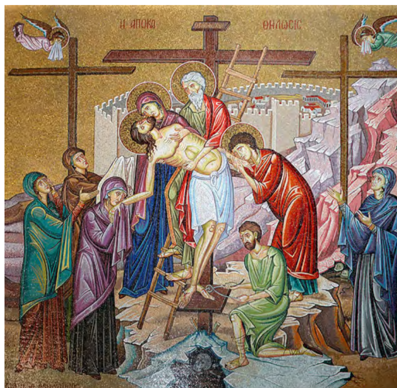
Снятие с креста. Мозаика храма Воскресения Христова в Иерусалиме.

Пасхальная радость есть святая радость, которой нет и не может быть равной на всей земле.