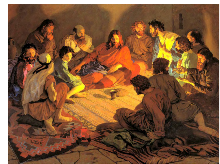
В Четверг Страстной недели, в который вспоминается Тайная вечеря, на которой Иисус Христос установил таинство Евхаристии и совершил омовение ног учеников, молитва Христа в Гефсиманском саду и предательство Иуды.

В этот день Господь установил Таинство Причащения, поэтому все православные христиане стремятся причаститься Святых Христовых Таин на Божественной Литургии. Тропарь дня «Егда славнии ученицы на умовении вечера просвещаются, тогда Иуда злочестивый сребролюбием недуговав ом-