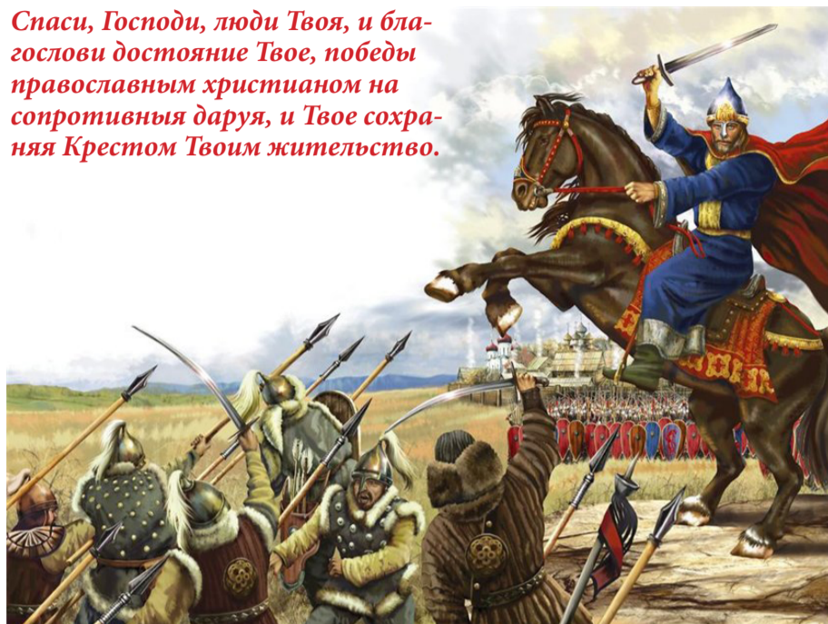
Святая Русь победила степь. Единственный наш Крестовый поход. Владимир Мономах и половцы.

Спаси, Господи, люди Твоя, и благослови достояние Твое, победы православным христианом на сопротивных даруя, и Твое сохраняя Крестом Твоим жительство.