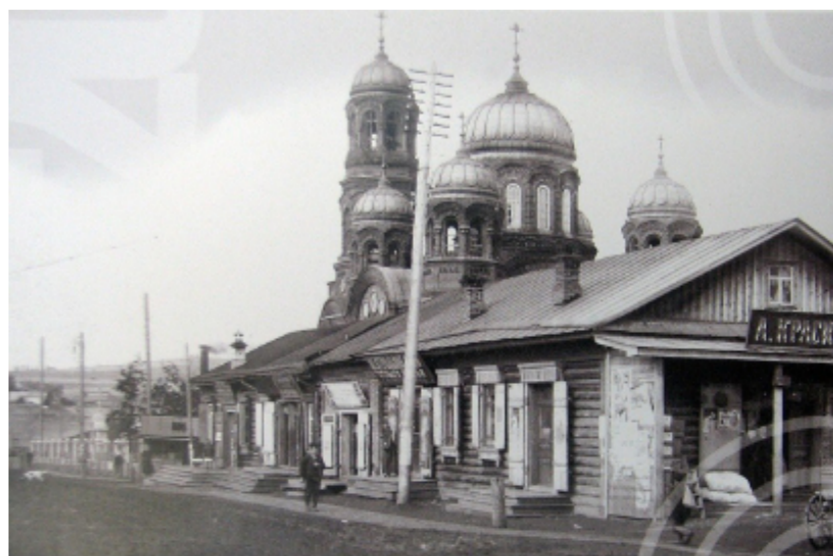
Благочинию Лысьвы 220 лет. Поселок Лысьвенский завод, Храм Святой Троицы. Вид с пересечения улиц Шуваловская-Торговая (Мира-Смышляева).