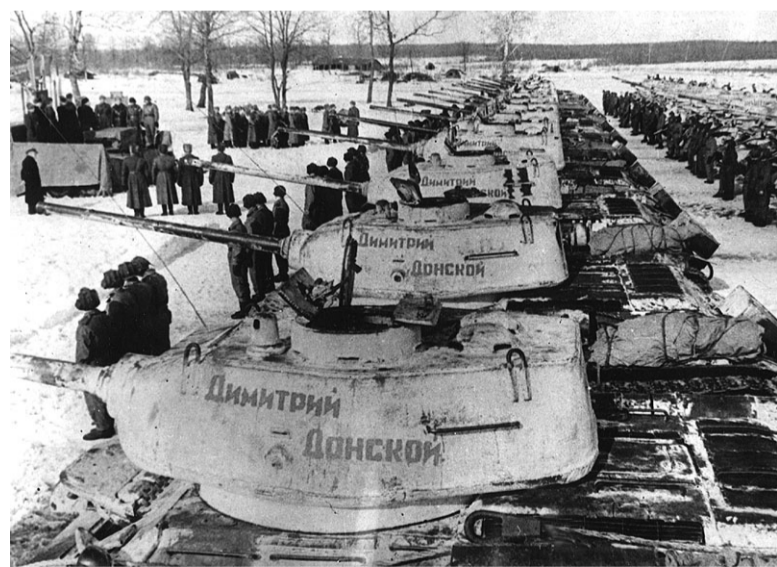
Март 1944 года. Тульская область, район д. Горелки. Русская Православная Церковь передает армии боевые танки Т-34 и ОТ-34. На башнях танков видна надпись, выведенная красной краской - «Дмитрий Донской».