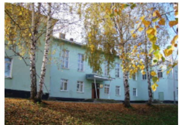
Россия, Пермский край, Лысьва. Здание музыкальной школы на ул. Никулина.

ей дальнейших успехов в благом деле духовного воспитания молодых граждан Лысьвы! Памятный знак «Герб Пермского края» представляет собой изображение Герба Пермского края. Основные его символы означают: Красный цвет – отвагу и мужество. Белый медведь – северную фауну. Евангелие - Христианскую веру. Именно так. Ведь наш Пермский край один из немногих субъектов России, имеющий в гербе Православную символику. Как, в общем-то, и само наше Государство Российское, имеющее в своем гербе Святого Георгия-Победоносца.