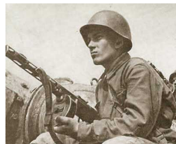
Защитник Отечества в Лысьвенской каске.

Угодники Божие Дмитрий Донской и Александр Невский на защите Отечества нашего. Священная война 1941-1945 годов.