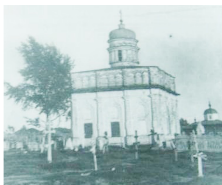
Благочинию Лысьвы 220 лет. Кладбищенская часовня во имя апостола и евангелиста Иоанна Богослова. Поселок Лысьвенский завод. Фото: ВК. Лысьва. Свято-Троицкий храм.

Мы закрываем двери своего сердца от Бога, а Господь стоит смиренно, не вторгается насильно в нашу душу, а ждет нашего покаяния, предлагает нам его. «Я предлагаю простить твоих родственников. Я предлагаю тебе простить твоих ближних. Я предлагаю изменить тебе жизнь, сколько бы её не осталось