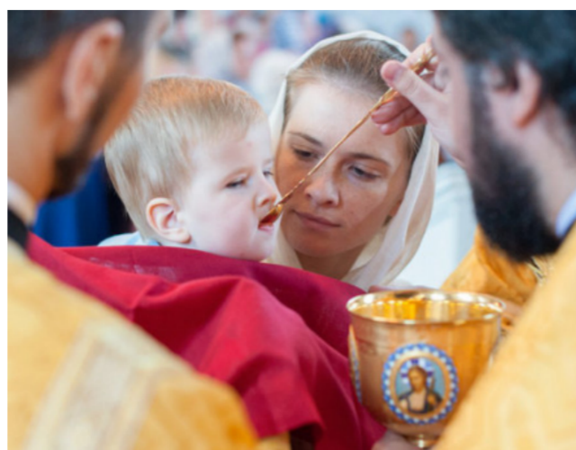
Причащение есть Таинство, в котором верующий под видом хлеба и вина вкушает (причащается) Самого Тела и Крови Господа нашего Иисуса Христа во оставление грехов и в Жизнь Вечную.

Так Она на протяжении первых семи веков собиралась и утверждала истину. При чем, все кто собирались - представители единой