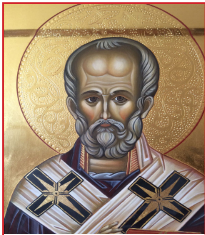
Святитель Николай, архиепископ Мерликийский, Чудотворец.

«Святителю отче Николае, моли Бога о нас!»