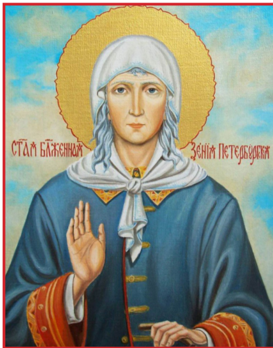
Святая блаженная мать Ксения, моли Бога о нас.

Юродивый поистине мертв для исполненного соблазнов мира. Кровь его — открытое небо, одежда — грязные