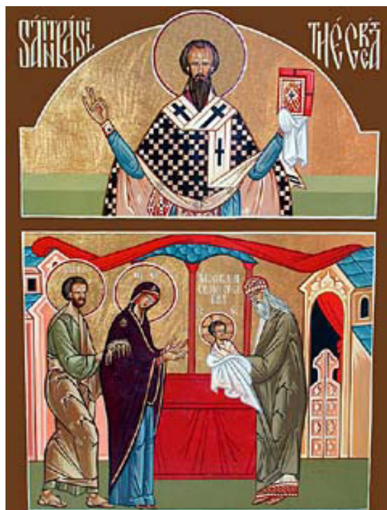
Обрезание Господне. Сверху образ свт. Василия Великого.

В этот день Богомладенцу дали имя, которое небесный вестник открыл прежде