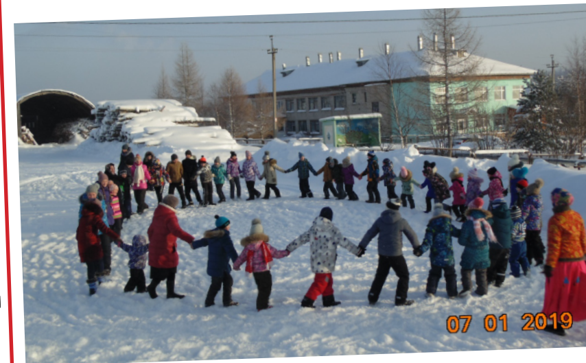
Архив издания «Весть Православная» на сайте храма Святой Троицы (Лысьва). Адрес: http://svytoyka-lysva.ru

Немного успокоились эмоции, и хочется поделиться со всеми своей радостью.