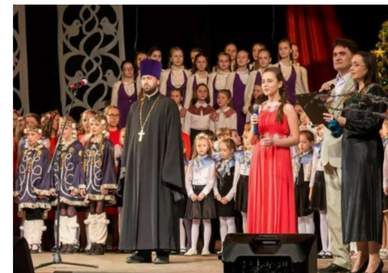
Большой традиционный Рождественский концерт. Лысьва. Культурно-деловой центр. 2018 год.

Приглашаем вас на ледовый городок у храма Святой Троицы! До самой весны для вас большая и малые горки. В храме можете погреться, имеется туалет.