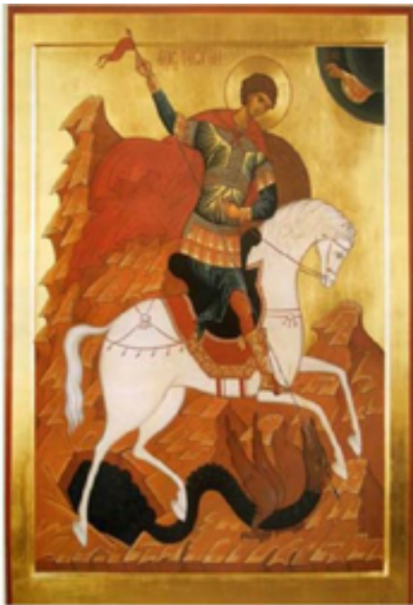
Покровитель воинов Святой Георгий-Победоносец. Его изображение находится в гербе России.

Чуть позже в дембельском альбоме знакомого пограничника прочитал: «ПВ – щит страны! Остальные войска – заклепки на нем!». Ещё и рисунок соответствующий был приложен.