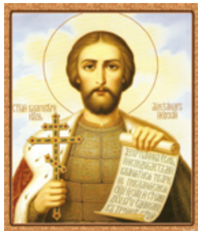
Особо почитаемый в народе великий русский правитель, полководец, мыслитель, святой благоверный князь Александр Невский.

Но основную роль мы обязаны уделить составляющей «тыл». А что такое тыл? Это наше общество. Что в нем, в умах его, то и всюду: и в быту, и в армии тоже. Только общество может воспитать истинного защитника Отечества. В здоровом обществе растёт здоровое поколение. Имеется в виду, что представители его знают, что такое 9 Мая, сколько будет «2+2» и могут щит в руках удержать. Причем не уклоняясь от его почетного несения.