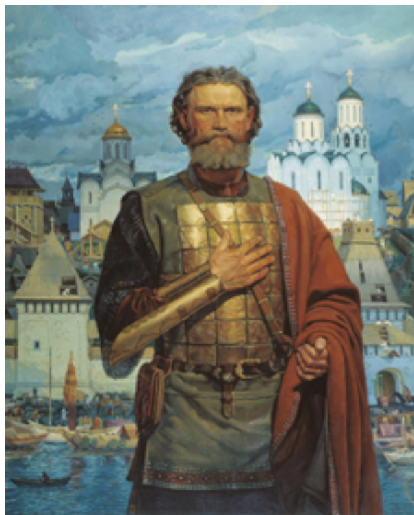
Победитель Куликовской битвы великий князь Московский и Владимирский Дмитрий Иванович Донской.

Но основную роль мы обязаны уделить составляющей «тыл». А что такое тыл? Это наше общество. Что в нем, в умах его, то и всюду: и в быту, и в армии тоже. Только общество может воспитать истинного защитника Отечества. В здоровом обществе растёт здоровое поколение. Имеется в виду, что представители его знают, что такое 9 Мая, сколько будет «2+2» и могут щит в руках удержать. Причем не уклоняясь от его почетного несения.