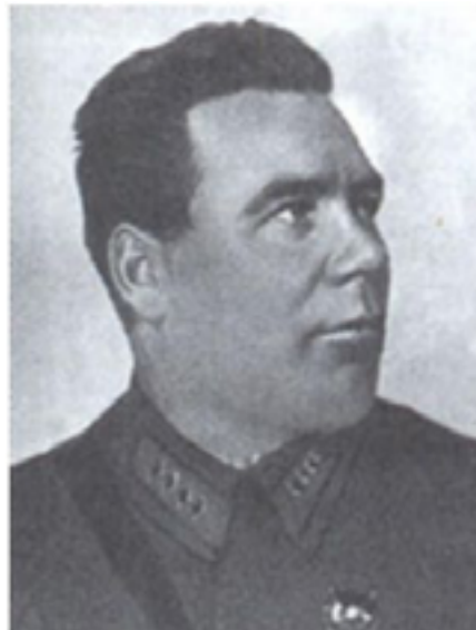
Первый нарком ВМФ СССР лысьвенский столяр Петр Александрович Смирнов.

партнеры» со своими белоснежными улыбками. Не стесняясь, стреляют они информационными зарядами по умам подрастающего поколения России, насаждая лживые ценности, подменяя даже героические страницы нашей истории.